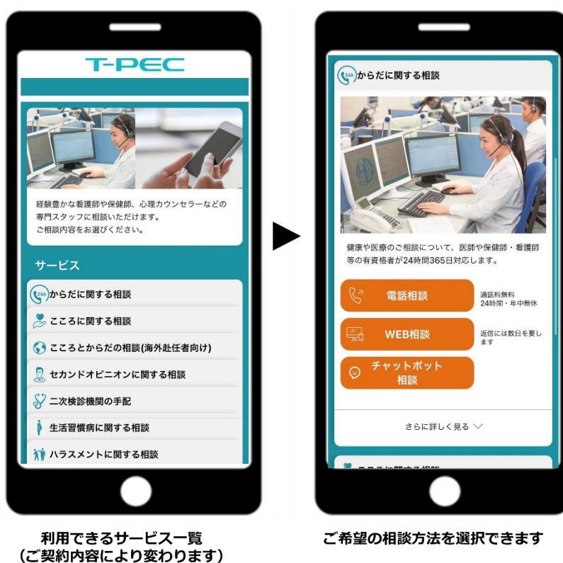
利用できるサービス一覧 (ご契約内容により変わります)